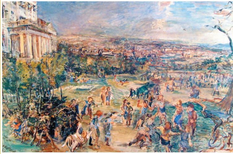
Oskar Kokoschka, Wien vom Wilhelminenberg

VEREIN ZUR FÖRDERUNG DER FORSCHUNG AUF DEM GEBIET DER ARTERIOSKLEROSE, THROMBOSE UND VASKULÄREN BIOLOGIE (ATVB)