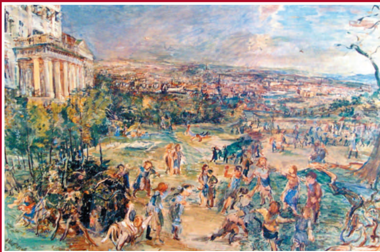
Oskar Kokoschka, Wien vom Wilhelminenberg

VEREIN ZUR FÖRDERUNG DER FORSCHUNG AUF DEM GEBIET DER ARTERIOSKLEROSE, THROMBOSE UND VASKULÄREN BIOLOGIE (ATVB)